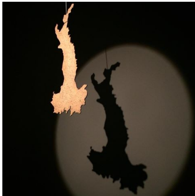
Luciano Fabro, L'Italia, 1968